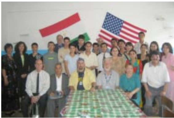
Преподаватели Программы Обмена, гости из Посольства США и учащиеся в школе для глухонемых детей