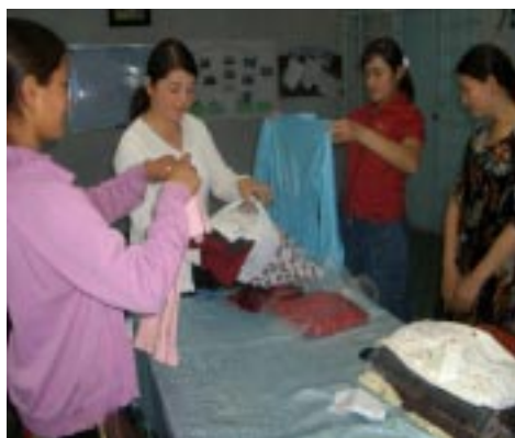
Ребята из ИЦО г. Канибадама складывают собранную одежду для детей-сирот

повышения роли молодых людей в обществе. Разрабатывая и выполняя проекты служения обществу, молодежь осознает, что она способна и может принести какую-то пользу для своей общины и улучшить общество, в котором она живет. Как считают сами ребята, эта деятельность помогла им понять важность волонтерства и работы в общине. Мы ждем еще больше проектов служения обществу от учащихся ГПВО!