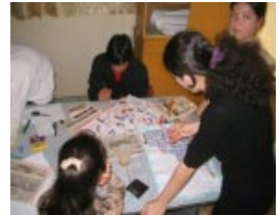
Учащиеся из ИЦО г. Чкаловска создают игры для ребят из детского сада

провели оценку потребностей жителей общины, чтобы узнать как помочь им и поставить реалистичные цели, которые можно выполнить всем классом, убедиться в том, что проект, который они разработают на самом деле принесет пользу общественности. Ребята разработали проекты по оказанию помощи инвалидам своей общины, помогая им различными способами: кто-то из ребят решил собрать деньги, продукты питания и одежду, другие помогли убрать помещение или мусор со двора, покрасить забор и посадить деревья. В общем, ребята старались помочь, как могли. Например, учащиеся ИЦО г. Чкаловск своими руками составили игру и подарили ее детям из детского сада. Ребята