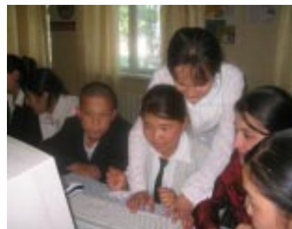
Киргизские учащиеся делают первые шаги в изучении компьютерных технологий при помощи своих сверстников из ИЦО г. Чкаловска

Это уникальный пример того, как Интернет Центр Образования объединяет учащихся из других стран, не только в режиме онлайн, но и в реальном мире. Мы желаем удачи ребятам из Киргизии и говорим «Добро Пожаловать!» другим учащимся из стран Центральной Азии и всего мира!