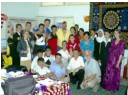
ИЦО г. Исфары и учащиеся Программы Обмена Будущими Лидерами 2006 - 2007 г. вместе с учителями из США

Мы поздравляем наших победителей и желаем им больших успехов в наступающем году учебы и проживания в США!