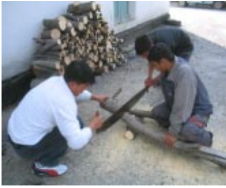
Ребята из Гулякандоза пилят дрова для людей со слабым зрением

Апрель месяц был особенно волнительным месяцем для учащихся проектных групп и клубов ИЦО, так как деятельность этого месяца была посвящена Международному Дню Служения Молодежи Обществу. У учеников в течение всего месяца была возможность не только узнать о волонтерской деятельности, но и самим стать настоящими волонтерами, готовыми оказать посильную помощь жителям своей общины. Несмотря на то, что проведение Международного Дня Служения Молодежи Обществу было назначено на 21 – 23 апреля, ребята решили выполнить несколько проектов в течение всего месяца, а количество ребят, вовлеченных в эту деятельность, достигало, порой, до 100.