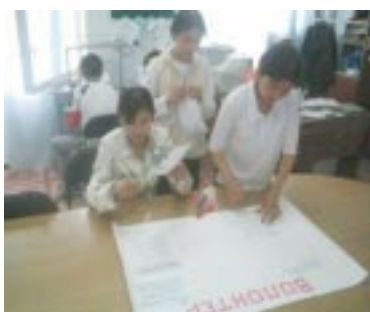
Создание стенгазеты о ВДСМО и о волонтерстве

В этом месяце в рамках празднования Всемирного Дня Служения Молодежи Обществу (ВДСМО) наши Клубы Юных Лидеров (КЮЛ) провели очень полезные мероприятия, к которым они отнеслись с большой ответственностью и энтузиазмом. Одной из главных целей КЮЛ было оказать как можно больше помощи общине с привлечением других людей из общественности. Однако, до начала мероприятий ВДСМО, юные лидеры провели презентации в своих ИЦО и создали очень содержательные стенгазеты, рассказывая членам своей общины и учащимся других школ о ВДСМО, его истории, о волонтерстве и волонтерах, о том как они могут помочь своей общине. Учащиеся также говорили о предстоящих планах, которые будут выполнять КЮЛ и проектные группы для ВДСМО. Юные лидеры также принимали участие на форуме ВДСМО, на котором у них была возможность обсудить вопросы, касающиеся здоровья, инвалидности, и поделиться своими идеями о мероприятиях ВДСМО. Таким образом, ребята смогли