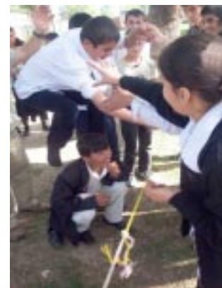
Гиссарские учащиеся работают вместе над преодолением препятствия

Каждый центр тепло и радушно, с хлебом и солью, с музыкой и танцами встречал американских гостей. В этом ярком мероприятии принимали участие учащиеся не только ИЦО, но и всей школы, начиная с учащихся младших классов и преподавателей и заканчивая директором школы. Учащиеся познакомили гостей с национальными традициями и обычаями таджикского народа. Например, учащиеся школы No. 10 г. Душанбе и учащиеся ИЦО с. Чорбог показали таджикские свадьбы с традициями, характерными для каждого региона. В Истаравшане ребята решили показать «гавхорабандон» - первое укладывание новорожденного в «гавхору» - национальную колыбель. В Кулябе девочки провели показ национальной одежды «чакан» - платья, вышитые красочными узорами. Ребята подготовили приветственные речи, презентации и стихи о своем городе и крае не только на родном, но и на английском языке.