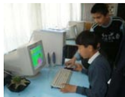
Член КЮЛ учит юных гостей ИЦО г.Кайраккума рисовать графические рисунки

Мы благодарим все КЮЛ и проектные группы за усердную и полезную работу в этом месяце, и надеемся, что они будут проводить День Служения Молодежи Обществу не один раз в год, а каждый день.