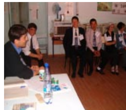
Психологи отвечают на вопросы учащихся по конфликту и другим проблемам

Форумы с психологами играют важную роль в жизни подростков. Учитывая то, что не в каждой школе имеется свой школьный психолог, к которому мог бы обратиться ученик в трудную минуту, советы и ответы, исходящие от психологов, являются очень важным и вспомогательным звеном, которое помогает подростку разобраться в самом себе и окружающих.