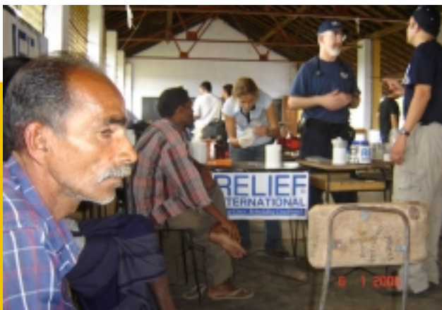
Команда медиков-спасателей Relief International оказывает медицинскую помощь жителям Шри - Ланки.