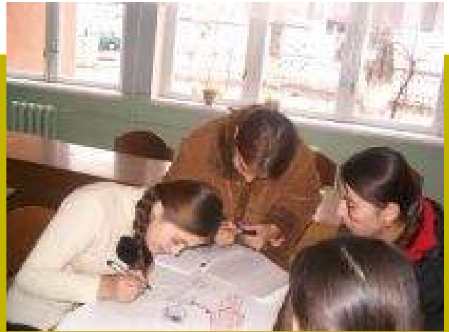
Ученики Интернет- Проекта рисуют свой план гендерных вопросов. Лицей #1, Рудаки

23 декабря, 2004 года в ИЦО Рудаки прошёл семинар «Гендер и положение женщины в семье». Ученики Интернет - Проекта из Рудаки и Школы #3 из Нурека приняли участие в этом семинаре.