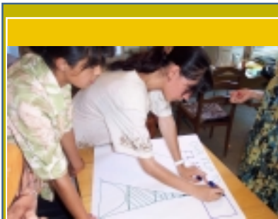
“Путешествуя по Миру”. Преподаватели во время семинара по английскому языку, Душанбе, Школа #10