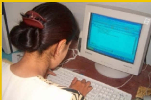
Ученица из Хорога делает заметки, используя программу Word, Хорог, Школа #2