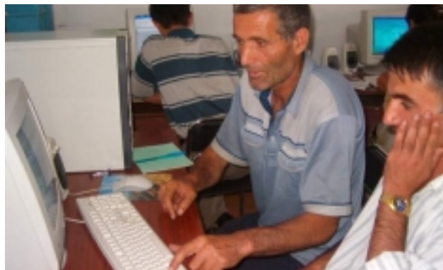
Преподаватели из Хорога работают на компьютере и в Интернете, Хорог, Школа #2