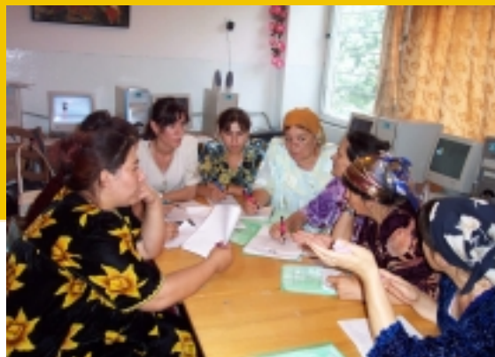
Преподаватели работают в группах, чтобы создать новые методы обучения.

Relief International - Schools Online Улица Павлова, 18, Душанбе, Таджикистан 734003 Тел.: (992372) 21-06-55, Факс: (992372) 24-08-33 taj_office@schoolsonline.org , http://www.connect-tajikistan.org