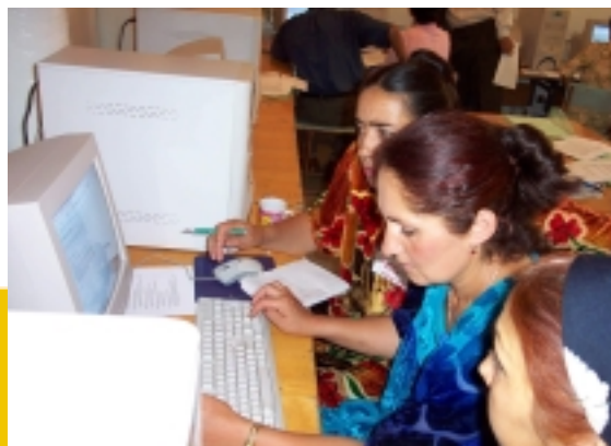
Ведущие Преподаватели планируют свою деятельность Лагеря по Английскому Языку