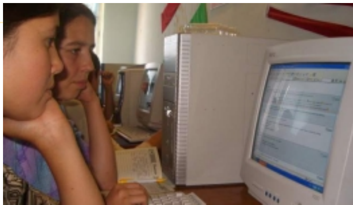
Два ученика Интернет-Проекта участвуют в форуме, Исфара, Школа #1.