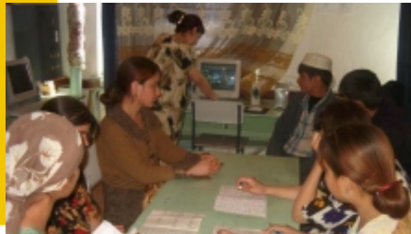
Команда Чорбога в процессе создания своей брошюры

В результате, каждый участник проекта имел шанс посетить виртуальный ресторан и попробовать виртуальную еду. Дух дружбы и взаимного понимания был внутри каждого ученика. Некоторые ИЦО Таджикистана, как например ученики школы #2, города Хорога совместно с сотрудниками RI-SOL, директором школы и своими афганскими друзьями, которые живут и работают в Хороге, решили приготовить Афганские традиционные блюда, чтобы ученики, которые выбрали темой своей брошюры Афганскую кухню смогли попробовать некоторые блюда, и понять традиции Афганистана.