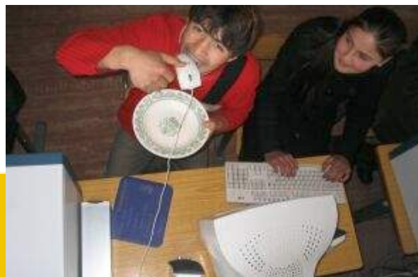
'Мышь на обег' - Ученики Интернет-проекта из Райзабада очень проголодались после просмотра брошюр школ-участниц на сайте

Все меню ресторанов, были придуманы учениками, и затем воплотились ими при помощи компьютера и интернета, а главной целью учеников было то, что их работу должен был увидеть весь мир. Некоторые ученики создали свои брошюры, используя программу HTML, что означает, что ученики Интернет-проекта сделали большой шаг вперед в своём профессионализме и творчестве. Это также показывает, что ученики не намерены останавливаться в своём познании компьютера и Интернета. Нашей целью является помощь ученикам в том, чтобы они нашли область своих интересов и своё место в той или иной области, используя технологии.