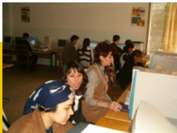
Сотрудники 'Project Hope' активно отвечают на вопросы участников форума

Ученики Интернет-проекта Таджикистана были очень заняты образовательными проектами, но они нашли время для участия в форуме и проявили весь свой энтузиазм и активность, когда мы пригласили их поучаствовать на форуме по проблемам туберкулёза в Таджикистане.