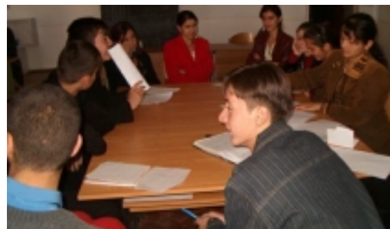
Ученики Интернет-Проекта во время дискуссии по выборам, Куляб, Лицей#1

Как результат данной деятельности, ученики отправили свои суммарные данные по политическим вопросам и вопросам выборов своим школам-партнёрам в США. После этого ученики приняли участие на форуме.