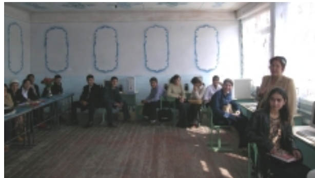
Ученики в ИЦО Вахша встречают RI-SOL

Мы приветствуем три новые школы в нашей Интернет-Общине!