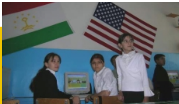
Девочки из Школы #8 используют Интернет в первый раз. Душанбе