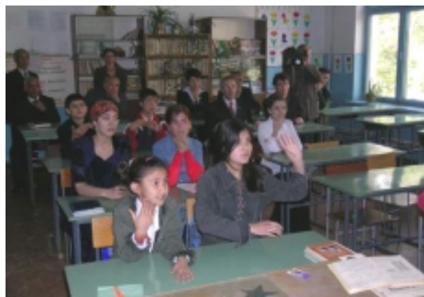
Ученики в школе для слабослышащих приветствуют своих гостей. Церемония Открытия, Душанбе

Проект по подключению школ Таджикистана к Интернету для Центральной Азии является проектом Relief International - Schools Online Программы Всемирная Гражданственность и Молодежная Филантропия и его осуществление стало возможным при основном финансировании со стороны Государственного Департамента США Отдела Образовательных и Культурных Отношений, Фонда William and Flora Hewlett и Фонда Global Catalyst