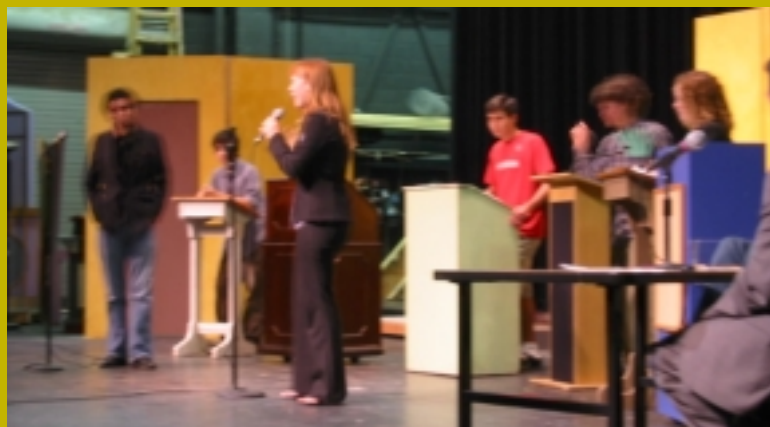
Выборы в Международной Школе Америкас, Сан-Антонио, США

На протяжении данной деятельности, ученики узнали о том, как укоренившаяся демократия в развивающейся стране