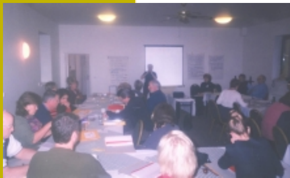
Дискуссия во время конференции, Прага.

Ученики и преподаватели из США также будут иметь возможность посетить этот вебсайт – где они смогут оставить свои комментарии, идеи и просто помочь таджикским ученикам найти как можно больше информации об английском языке.